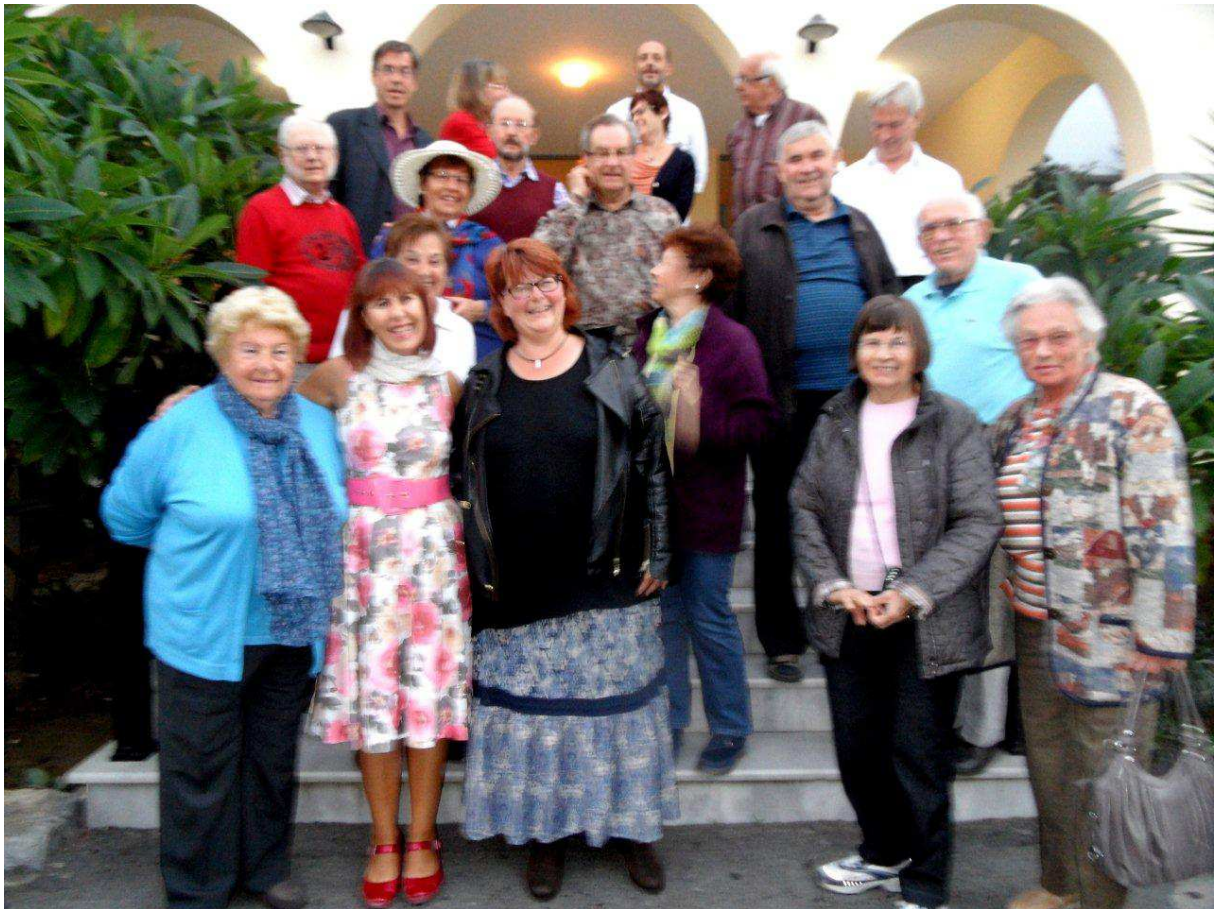
Gruppenbild vor der Abreise