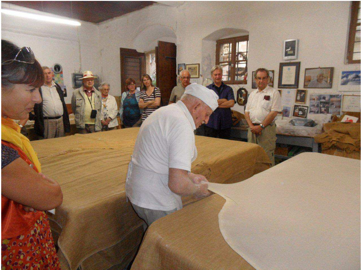
Besuch bei einem Blätterteig-Bäcker