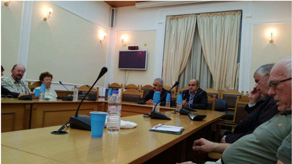
Gespräch in der Präfektur