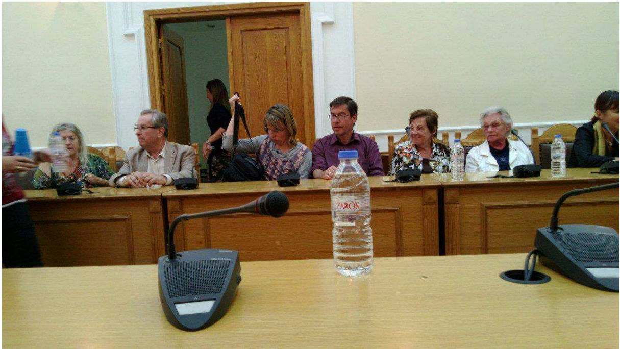
Gespräch in der Präfektur