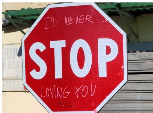
Verschönertes Straßenschild in Tirana